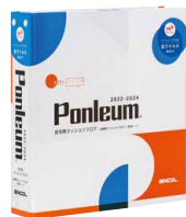
住宅用クッションフロア見本帳 Ponleum 2022-2024