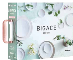
壁・天井・床 コーディネート集 BIGACE 2022-2024