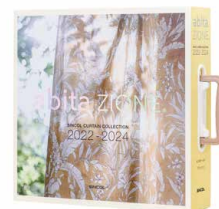
カーテン見本帳 abitaZiONE 2022-2024