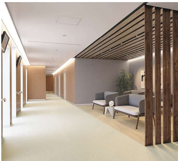
STP 7101 7104 (セラピア)