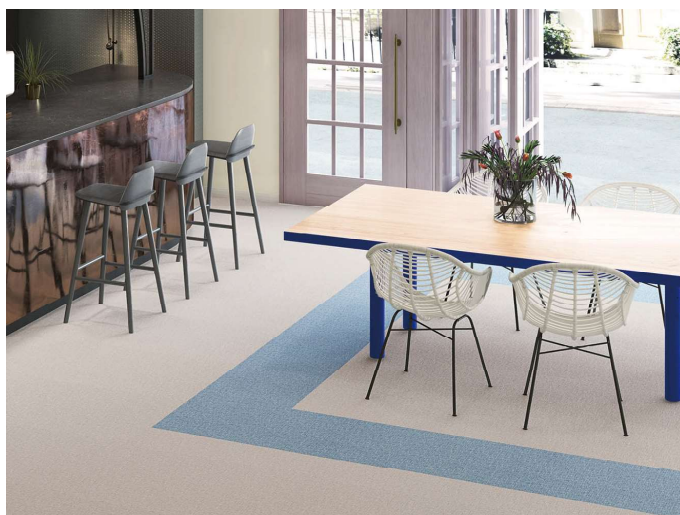
SEV7224 7228 (エブリア)