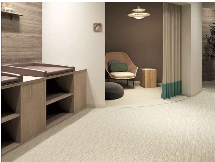
SEV7222 7206 (エブリア)