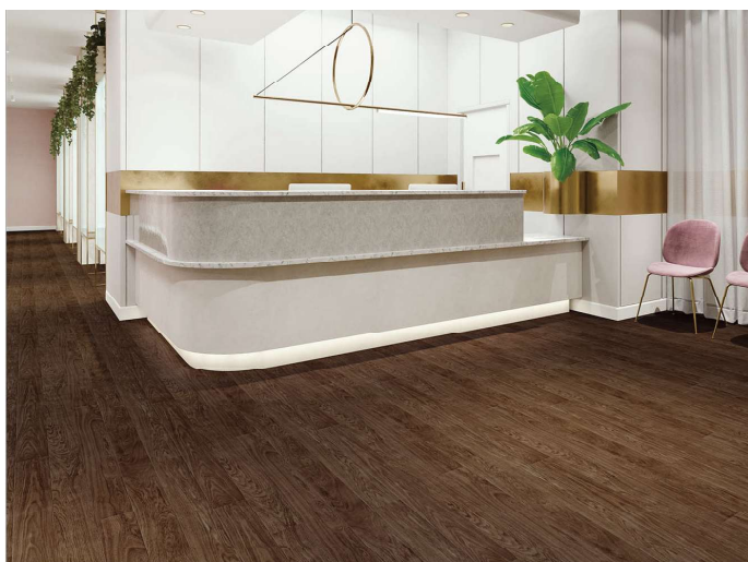
STF7155 (セラピア フィット)