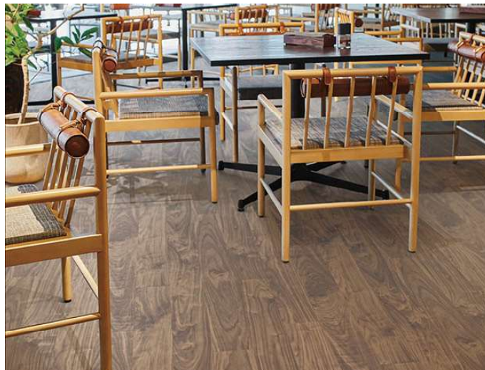
SEM7253 (エブリア ウッド)